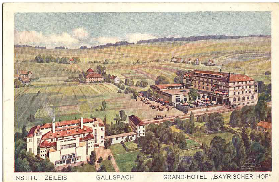
Abb. 5: Ansichtskarte, Farblithographie, ca. 1930. Institut Zeileis (1929 in sieben Monaten Bauzeit erstellt) und das eigens für solventere Heilungssuchende in dem kleinen Ort Gallsbach errichtete Grand Hotel „Bayrischer Hof“, erbaut 1930. Beide Gebäude existieren noch heute. Ebenfalls 1930 entstanden weitere Hotel- und Herbergsbauten aller Kategorien, um dem Patientenansturm zu begegnen.