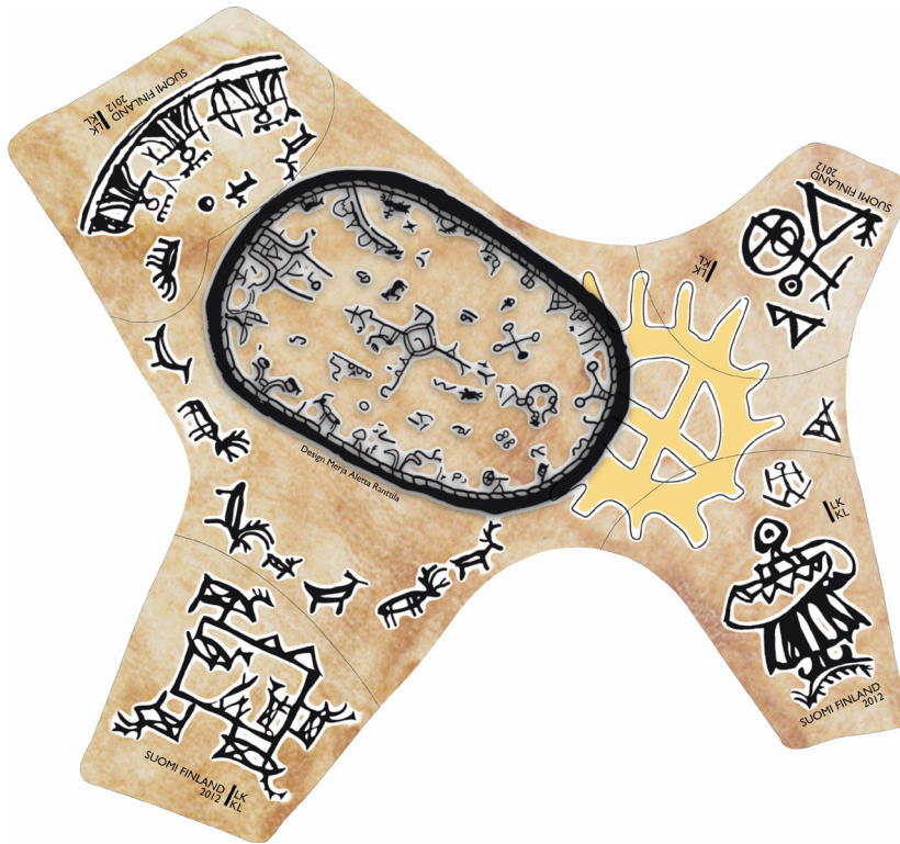
Abb. 1: Briefmarken-Blockausgabe der Finnischen Post vom 23. Januar 2012 mit samischer Schamanentrommel.

Schamanentrommel ist das zentrale Bildmotiv; in den vier Bildecken befinden sich für den regulären postalischen Gebrauch jeweils austrennbare selbstklebende Postwertzeichen, deren wechselnde Formen wiederum den Landschaftstypen (Fjällen) nachempfunden sind und die mythologisch-schamanistische Darstellungen zeigen. 4