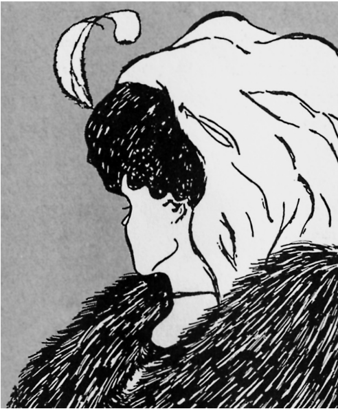
Abb. 6-3 Ist dies eine ältere Frau mit einer großen Hakennase, die nach links blickt? Oder ist der untere Teil jener Nase in Wirklichkeit eine Unterkieferlinie, sodass wir von hinten links eine Dame mit perückenartigem Haar und einem schweren Pelzmantel betrachten (aus Pott 2004, S. 12)?

nete Methoden zur Verfügung stehen; so konnte zum Beispiel die „Tatsache“ der elektrischen Ladung nur mittels der Erfindung des Elektrometers festgestellt werden, und die Astronomie hat mit der Erschaffung zunehmend leistungsstarker Instrumente immer neuere „Fakten“ entdeckt.