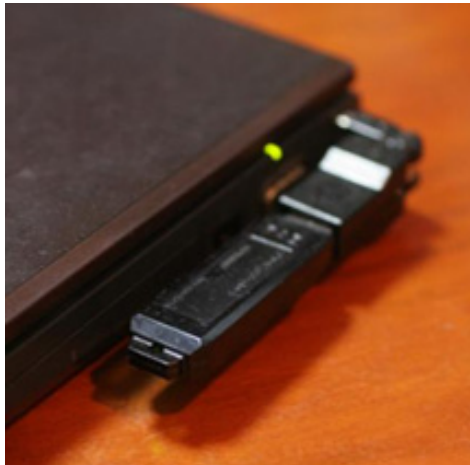
Abb. 1: Rpg102 über den USB-Port mit dem PC verbunden

Als RNG wurde ein Rpg102 (FDK Corporation) benutzt und über eine USB-Schnittstelle mit dem PC verbunden (Abb. 1). Die Hardware wurde über eine Software gesteuert, die von Visual Studio 2008 (.Net Framework 3.5, C#) entwickelt wurde. Der RNG erzeugte damit im vorliegenden Experiment 512 Bits/Sekunde.